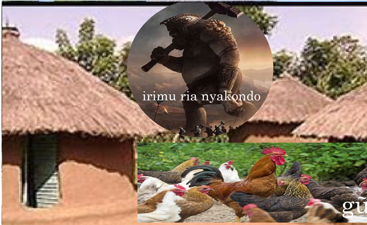
irimu ria nyakondo