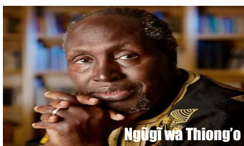
Ngũgĩ wa Thiong'o

Nake akĩgua ta arerwo acarie njamba cia gũthĩ kũgĩtĩra Hiti Akĩenga igege rĩria rĩake rĩthambagio na iria akamaga ng'ombe ciene Akiuga Ona ti kũmũgĩta nĩ nĩ kũmũruga na ndĩmĩthike Infakti tene ndarĩ thikahiti Ndũmĩrai ngirimiti ndĩmĩthece kĩrore tũthike Hiti Oigĩrĩrio nĩ kĩrĩndĩ, agĩtua