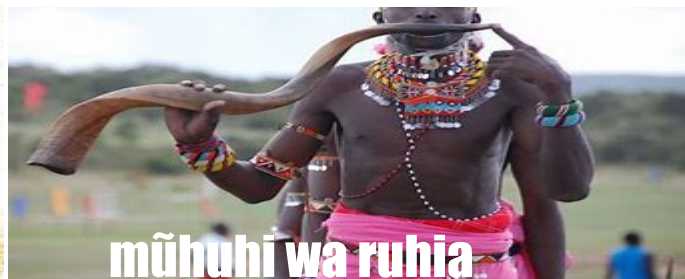
hĩa na kanya ka mbakĩ